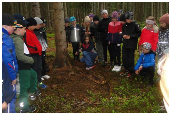
Foto: Bereich „Erleben und Wagen“ – wir bauen im Wald eine Kugelbahn

3./4. Schulstufe (fortlaufend): Bewegungstagebuch: Die Schüler*innen der 3. und 4. Schulstufe führen das Bewegungstagebuch „GESUND & MUNTER“ des Bildungsministeriums. Mit Hilfe des Heftes werden die unbedingt notwendigen körperlichen Voraussetzungen für einen gesunden und bewegungsaktiven Lebensstil dokumentiert und Fortschritte notiert. Des Weiteren finden die LP im Handbuch und online viele Anregungen, Tipps und Hilfestellungen in weiten Bereichen der Bewegung. Ein Pool an Spielen und praktischen Hinweisen wird ebenfalls angeboten.